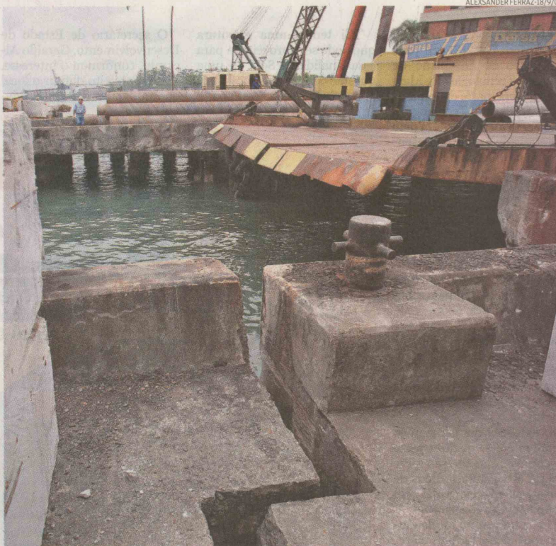
O atracadouro de balsas da Dersa do lado de Guarujá foi destruído por um navio chinês em julho passado

Os trabalhos estão a cargo da empresa Ster, contratada de forma emergencial para a construção de três novos berços. Na última na terça-feira, o secretário