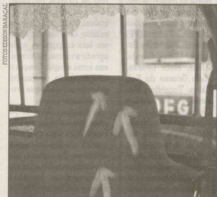
A viatura da Guarda Portuária foi atingida por 20 disparos

O assalto aconteceu por volta das 2h30 de ontem