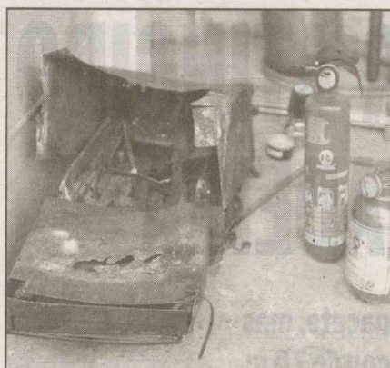
Na agência bancária, os marginais abandonaram um maçarico

Um terceiro equipamento teve a parte da frente quebrada. Na tarde de ontem o valor roubado estava sendo apurado. Um maçarico foi abandonado no banco.